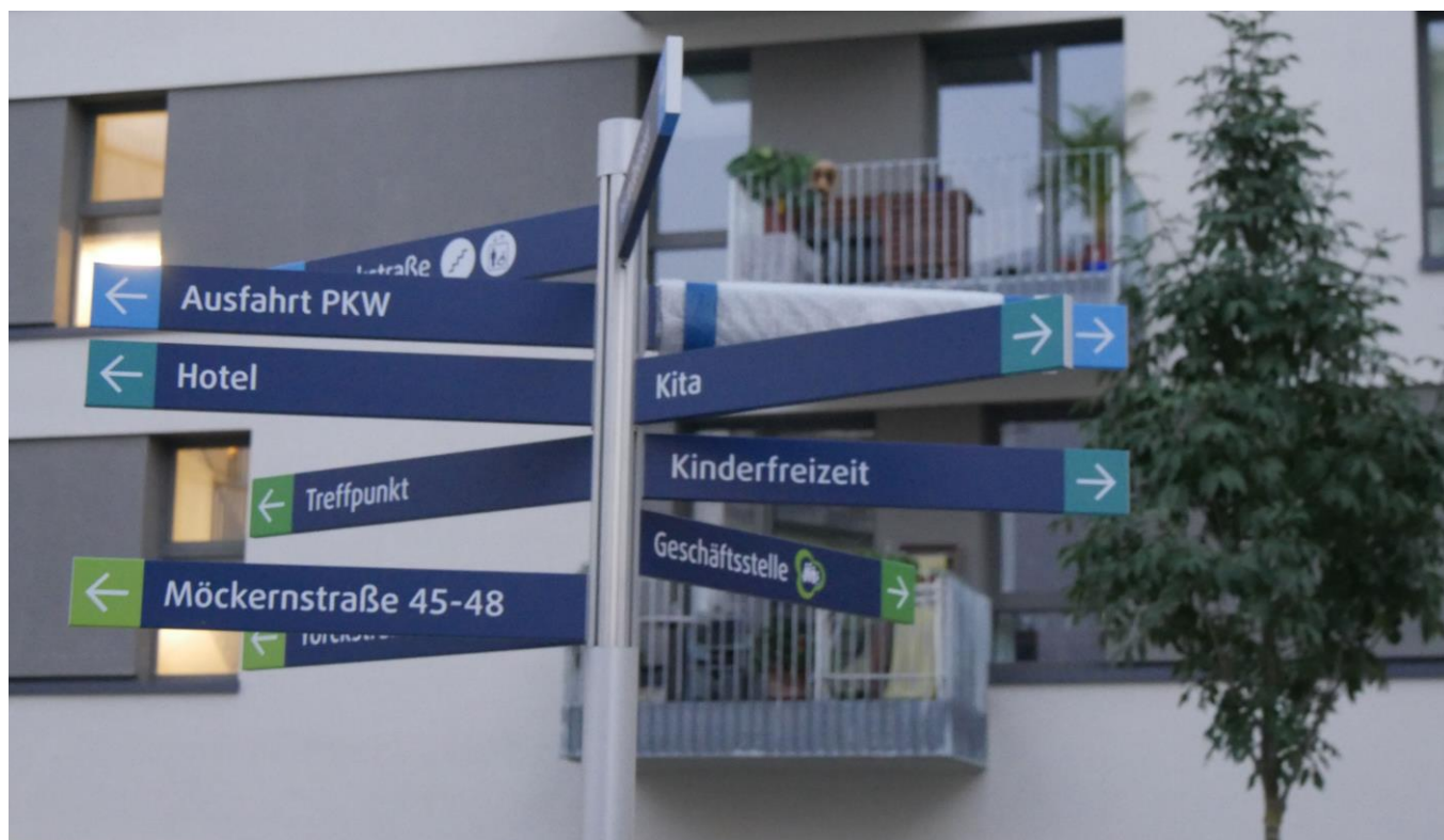
Projektcafé Möckernkiez

Liebe Interessierte am gemeinschaftlichen Wohnen,